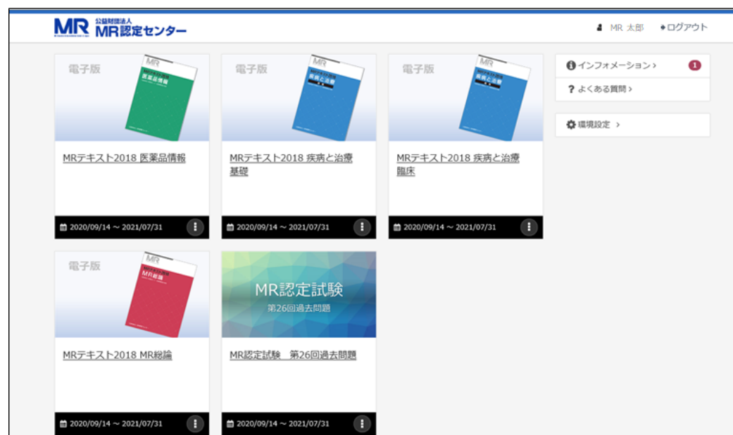
MR学習ポータル メイン画面 2020年10月 一部改変